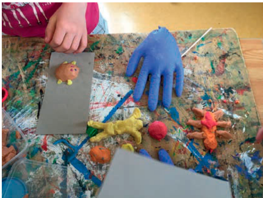
Abb. 7 und 8: Experimenteller Umgang mit der Thematik und Entdecken der eigenen Umsetzungsmöglichkeiten