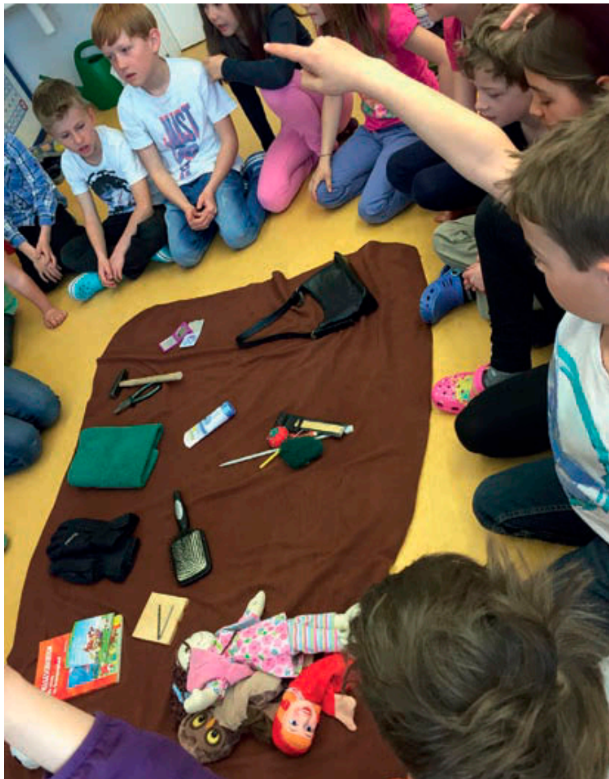
Abb. 1: Untersuchung von Alltagsgegenständen

ermöglicht, kreatives Tun bahnt die Entwicklung von eigenständigen Ideen und Entscheidungen, Experimentierfreudigkeit, den Ausdruck von eigenen Impulsen und die Freude am selbständigen Tun. Die Bedeutung ästhetischer Bildung und kreativer Erfahrung für den Wissenserwerb, für die Ausbildung der Persönlichkeit und die Förderung von Kompetenzen wird jedoch leider häufig immer noch unterschätzt. Gerade in der Primärpädagogik muss ein adäquater Unterricht die Entfaltung ästhetischer Bildung ermöglichen und fördern. „Jedem Kind, jedem Jugendlichen [...] ästhetische Wahrnehmung und ästhetische Praxis in dieser Eigenständigkeit und diesem Eigenwert zugänglich zu machen, ist eine der Aufgaben recht verstandener Allgemeinbildung“ (Klafki, 1992, S. 1). Substanzielle Mit- und Selbstbestimmung zeichnen einen interessengetriebenen Unterricht aus. So soll in der Primarstufe das Fach Bildnerische Erziehung nicht nur als formaler Kunstunterricht – der sich auf die bloße Vermittlung technischer Fertigkeiten beschränkt oder die oberflächliche Vermittlung großer Künstler voranstellt – verstanden werden. Das Fach Bildnerische Erziehung muss vielmehr eine handlungs- und projektorientierte Basis für einen fächerübergreifenden Unterricht in der Primarstufe bereitstellen (Leuschner & Koke, 2012). Auf diese Weise kann ein innovatives vernetztes Unterrichten aller Fächer der Ganzheitlichkeit im kindlichen Denken gerecht werden.