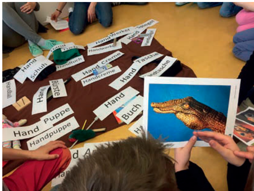
Abb. 5 und 6: Untersuchung und Vergleiche der Hände aus Darstellungen der bildenden Kunst